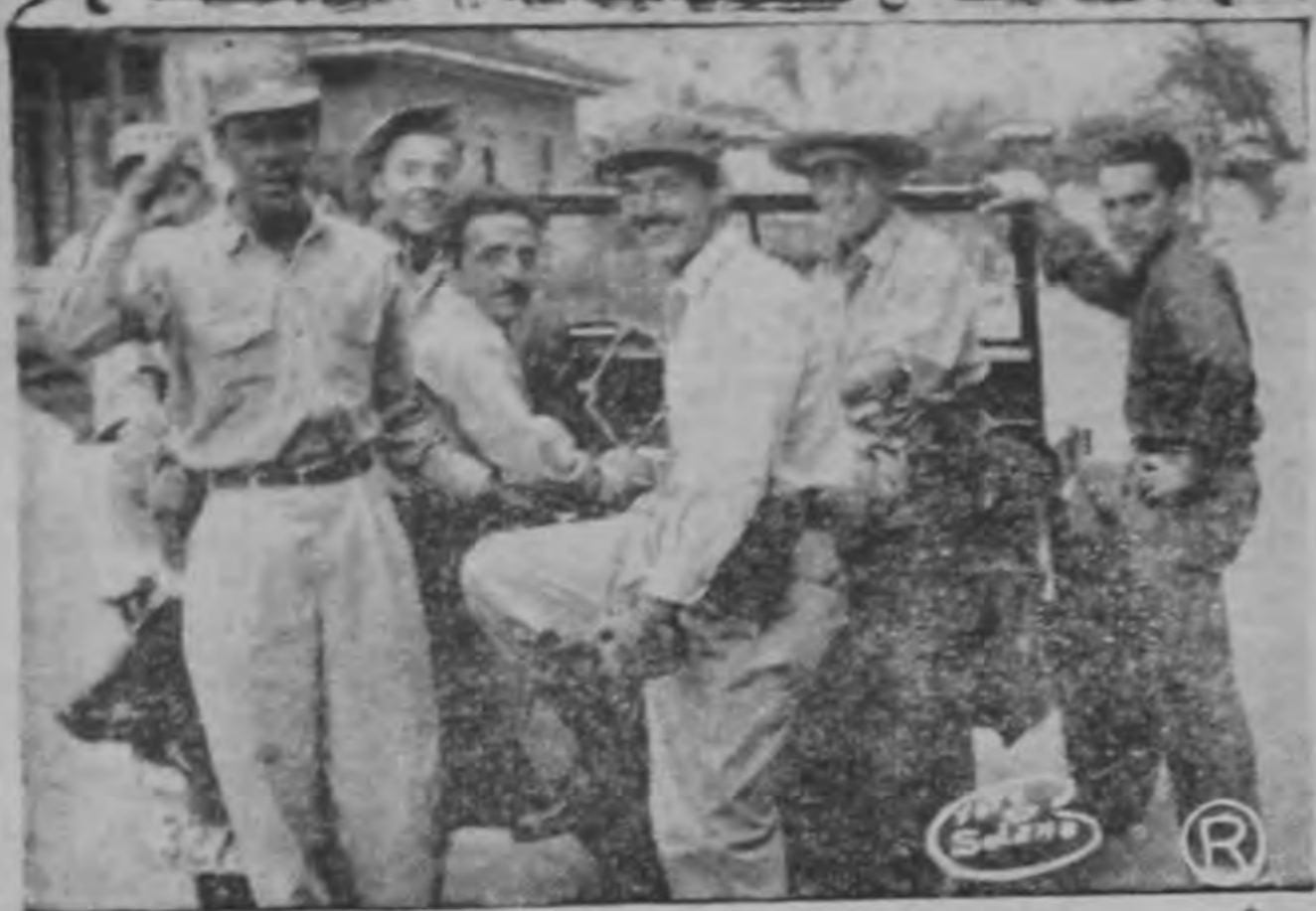
FRENTE A LA ESCUELA MILITAR están estos voluntarios que se presentaron el domingo a recibir órdenes.