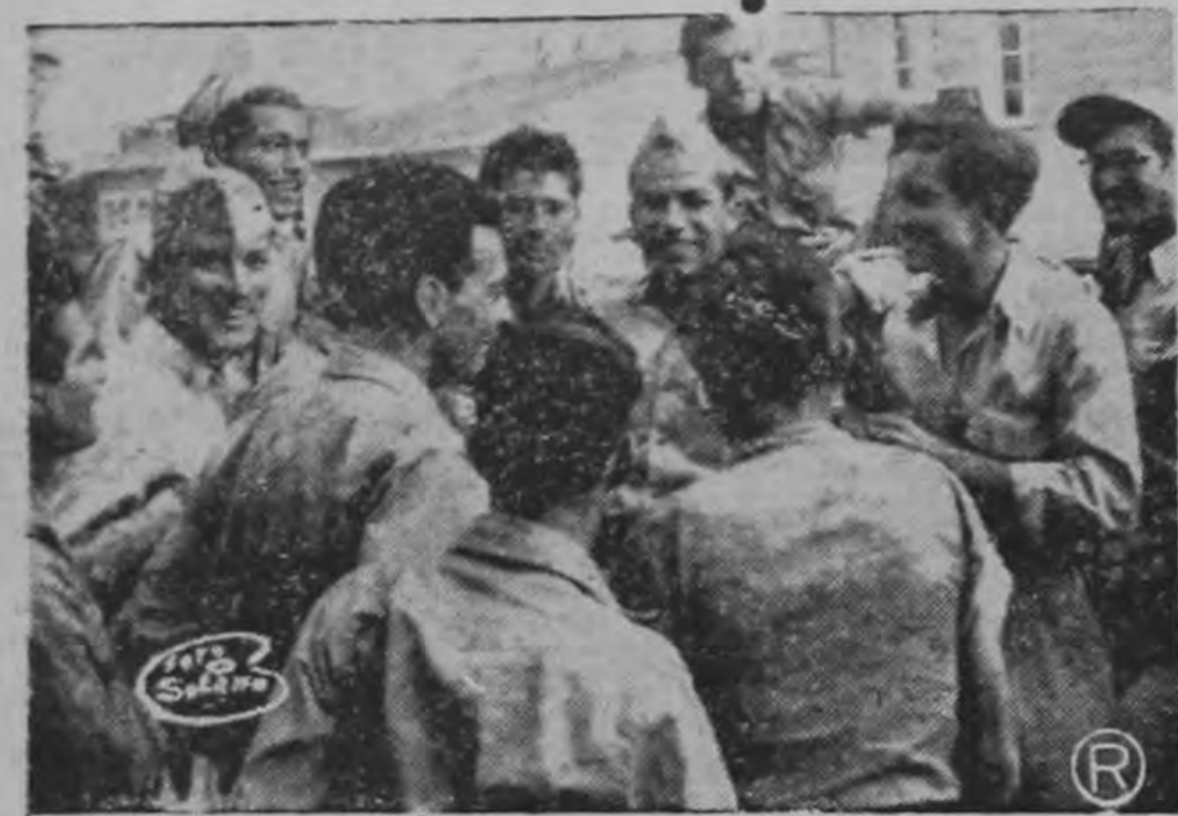
CAMARADERIA, se produce al encontrarse de nuevo voluntarios que formaron un solo cuerpo durante la pasada emergencia y que estuvieron listos el domingo.