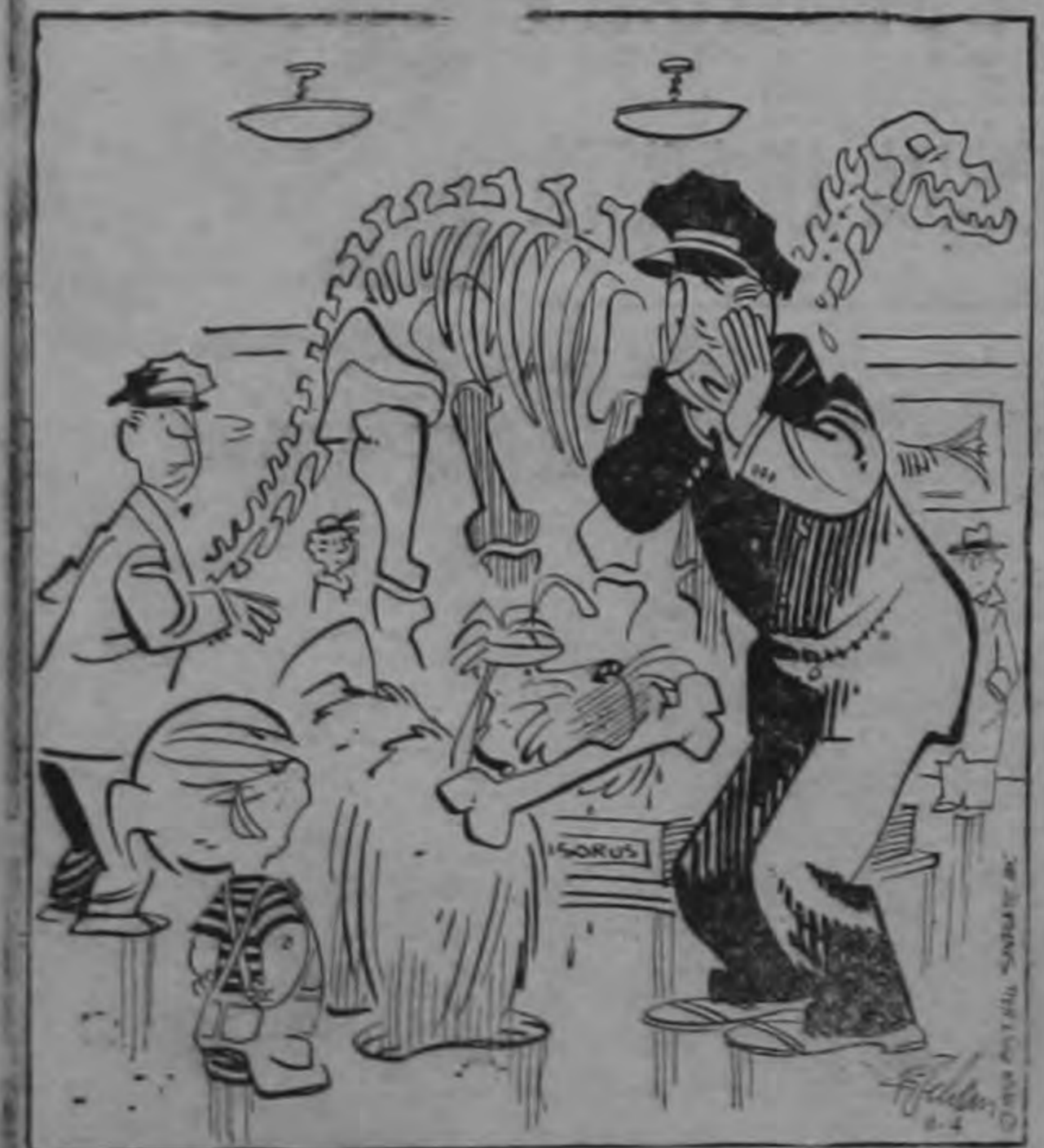
¿Te convenciste? Una vez que están muertos... se quedan muertos para siempre.