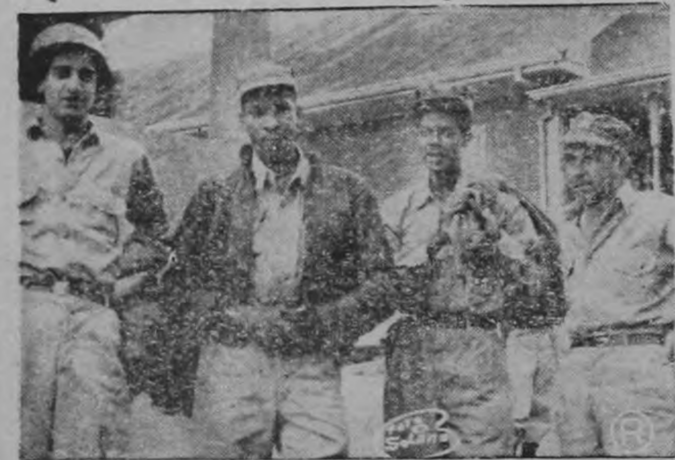
ALERTA, ante la posibilidad de que los cuerpos de voluntarios fueran necesitados para enviarlos de nuevo a la frontera norte en defensa del territorio nacional, estos muchachos dejaron las diversiones del domingo para estar listos.