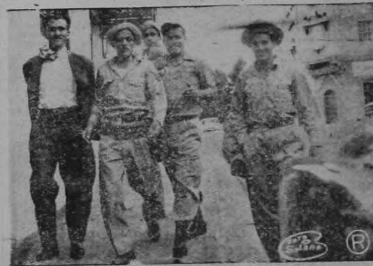
CORRIENDO AL ESTADO MAYOR, uno sin siquiera haberse cambiado la ropa a recibir las instrucciones que tuvieran los Jefes de la Fuerza Pública si se presentara una nueva emergencia.

de un terreno o terrenos que serán loteados y vendidos con facilidades de pago. Otro, para dar autorización a la Junta de Educación de Juan Viñas para vender dos fincas a la Municipalidad de Jiménez; y el tercero, relativo a contactos para el suministro de tuberías y maquinarias para construcción de cañerías, carreteras y caminos que son de mucha urgencia. A excepción del primer asunto, en el cual, por sugestión del diputado Manuel Antonio Quesada, se resolvió consultar a la INVU antes de autorizar a la Municipalidad de Jiménez para la compra de los terrenos, quedaron aprobados en primer debate, los otros dos asuntos.